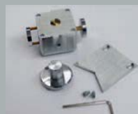
Адаптер для проволок/прутков или маленьких деталей диаметром 3-10 мм