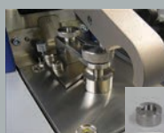
Адаптер для проволок диаметром 1-3 мм