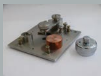
Набор адаптеров для маленьких деталей

Контроль материалов создаёт множество требований к проведению анализа. Возникает два специфических критерия: контроль образцов различной формы и размера и оптимальное расположение на искровом стенде. Набор адаптеров для SPECTROMAXx обеспечивает множество гибких и простых в использовании решений.