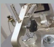
Адаптер для фольги или маленьких деталей